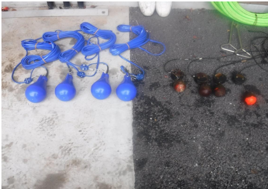
フロートスイッチ交換中