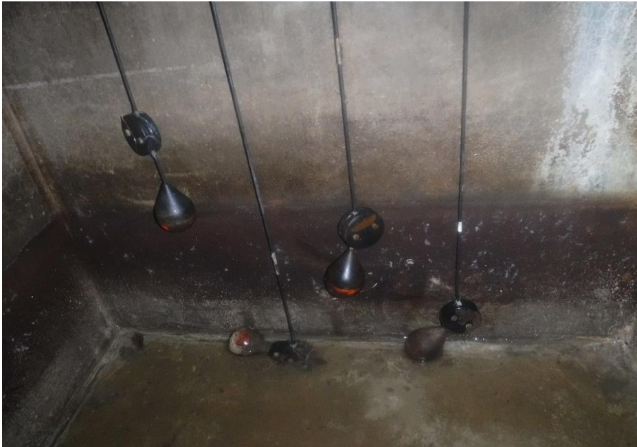
フロートスイッチ交換前