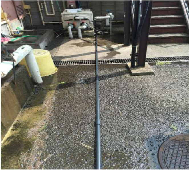
ポンプへ応急処置